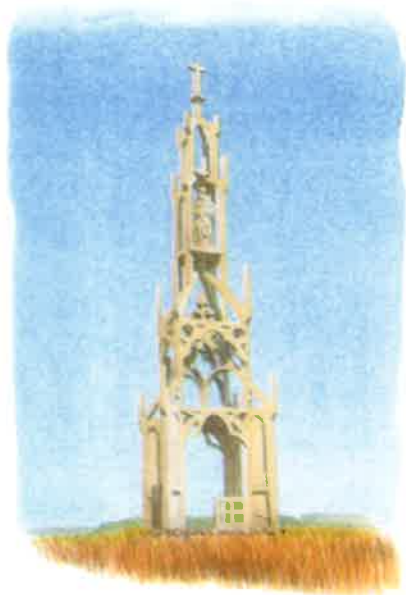
Notre-Dame du Suprême pardon

Circuit des bois clairs : 7,3 km - Jaune et Bleu - 1 h 45